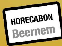
Horecabon voor iedere inwoner