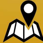
Promotie dag- en weekendtoerisme in Beernem