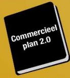
Strategisch Commercieel Plan 2.0