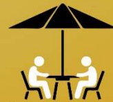
Grotere terrassen en parasols