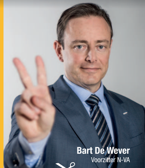
Bart De Wever Voorzitter N-VA