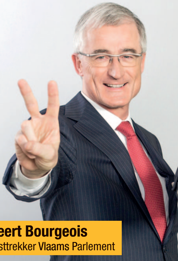
Geert Bourgeois Lijsttrekker Vlaams Parlement