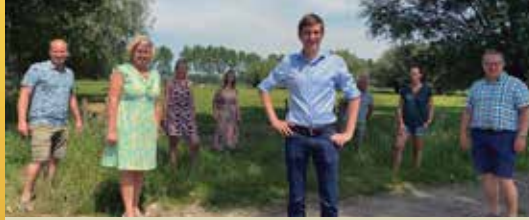
Maak Beernem nog groener. (p.2)