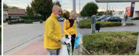
N-VA wil sluikestorten aanpakken (p.3)