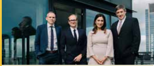
Beernem krijgt extra geld van Vlaamse Regering (p. 2)