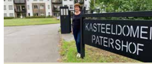
N-VA pleit voor belbus aan 't Patershof (p. 3)