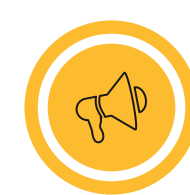
Beernemse weetjes p. 4 en 5