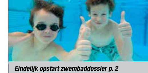
Eindelijk opstart zwembaddossier p. 2