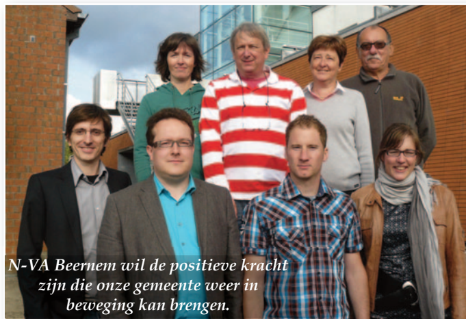
N-VA Beernem wil de positieve kracht zijn die onze gemeente weer in beweging kan brengen.

In de eerste plaats wil de N-VA de kracht van verandering verankeren in Beernem. We willen de gemeente opnieuw in beweging brengen. De N-VA wil opnieuw ambitie voor Beernem. Onze gemeente heeft nood aan beweging in plaats van stilstand. Stilstaan is achteruitgaan. De N-VA gaat voor efficiënt en spaarzaam besturen, klantvriendelijke dienstverlening, wil een woonbeleid dat reële behoeften invult en wonen in eigen gemeente betaalbaar houdt. De N-VA ondersteunt ondernemerschap en zet in op een veiliger verkeer en vlotte mobiliteit. De N-VA wil een warme gemeente waar jongeren hun ei kwijt kunnen en ouderen zich thuis voelen. Hoe we dit vorm geven, leest u in ons verkiezingsprogramma.