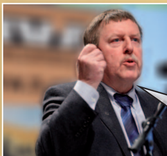
Siegfried Bracke N-VA-Kamerlid

“Ik stel keer op keer vast dat het onderscheid tussen CD&V, Open Vld en sp.a gewoon verdwijnt. Het zijn drie partijen die samen - en warmpjes - in het apparaat zitten. Kijk naar het debat over de gas- en elektriciteitsprijzen. Plots roept men energienetbeheerder Eandis uit tot vijand nummer 1. Laat me niet lachen. Wie bestuurt Eandis? Dat zijn 8 CD&V'ers, 4 sp.a'ers en 4 Open Vld'ers. Ook in die zin is de N-VA vandaag dé uitdager van het systeem.”