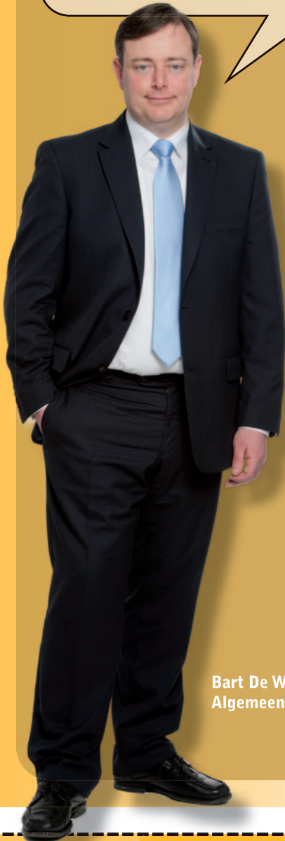
Bart De Wever Algemeen voorzitter N-VA

De N-VA kiest resoluut voor verandering. En ik vraag ook u om, samen met ons, die keuze te maken. Wil u de regering-Di Rupo weg, stem dan op 14 oktober op de N-VA!