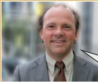
Philippe Muylers Vlaams minister van Financiën en Begroting

“Het Dexia-dossier hangt dit land als een molensteen om de hals. Als het verder fout gaat, stijgt de Belgische staatsschuld gigantisch. Ik vind dit gewoon hallucinant. De onbeantwoorde vragen stapelen zich ondertussen op. Maar Di Rupo zag geen beletsel om de Dexia-bestuurders kwijting te verlenen. Enkel het duidelijke ‘neen’ van de Vlaamse Regering deed de Belgische stem nog naar een ‘onthouding’ schuiven. Niet te begrijpen.”