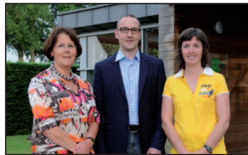
De N-VA werkt aan uw welzijn in de OCMW-raad.

OCMW-raadslid Vyncke: "In 2004 werd er een nieuw decreet lokaal sociaal beleid gestemd. Beernem koos ervoor om iedere zes jaar een lokaal beleidsplan te maken. Elk OCMW-raadslid krijgt de kans om hieraan mee te werken via verschillende thematische werkgroepen. Het lokale sociale beleid is uiteindelijk het resultaat van de acties die het OCMW, de gemeente, andere overheden en verschillende organisaties ondernemen om de sociale grondrechten voor iedereen te realiseren."